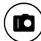
Фото (селфи) с первым учителем Тематическое фото, коллаж, поздравление, сюрприз, инсталляция и пр.

Видеоролик с участием первого учителя Интервью, поздравление, сюрприз, тематическая театрализованная постановка, флеш-моб, инсталляция, чаепитие и пр.